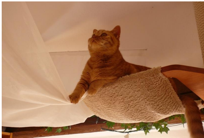
... ein Garnellenbollo?