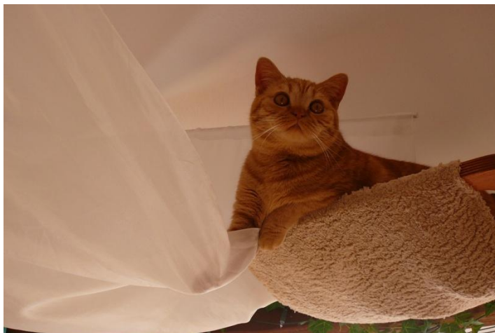
Santa Claude, da ist doch jemand im Flur!