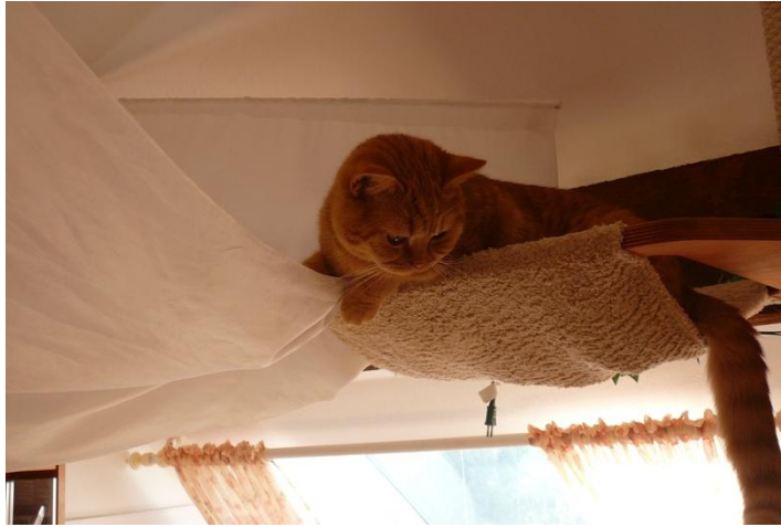
... oder ein Käserolli...