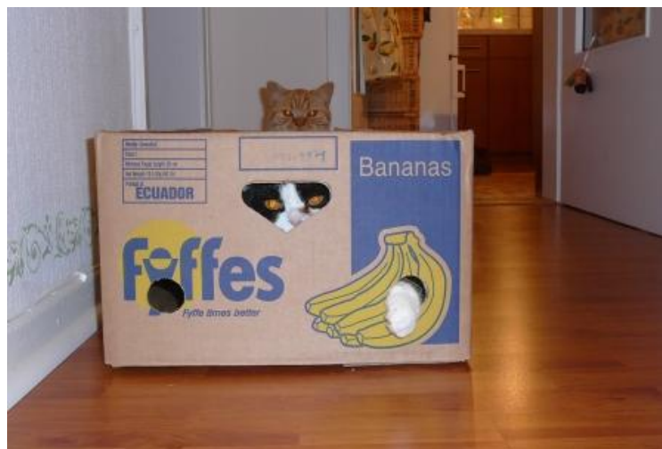
Und sie lässt nicht locker.