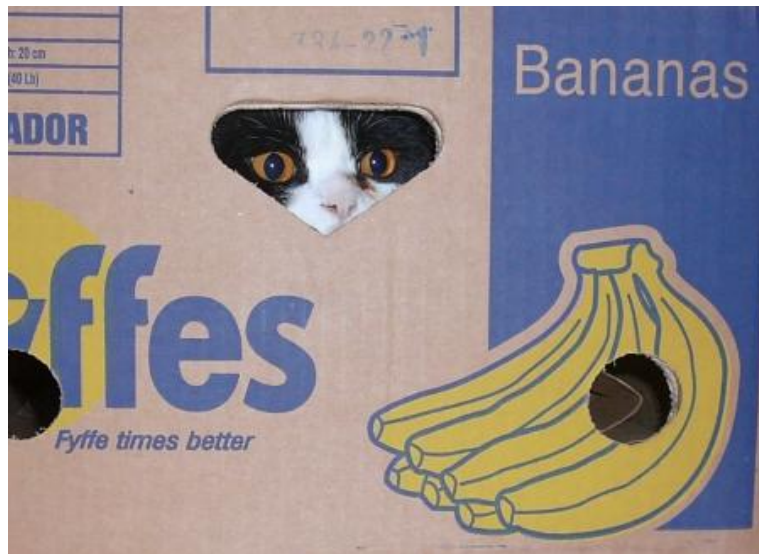
Bella Block bleibt am Ball.

dpa meldet: Die Polizei erbittet sachdienliche Hinweise, die zum Auffinden des verschwundenen Sir Henry führen können, an info@lost-cat.fe oder www.cataway.fe .