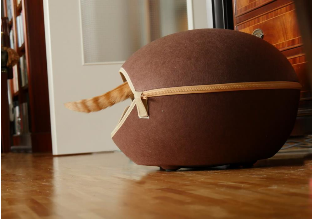
Das ist nur für Kerls, sagt er.