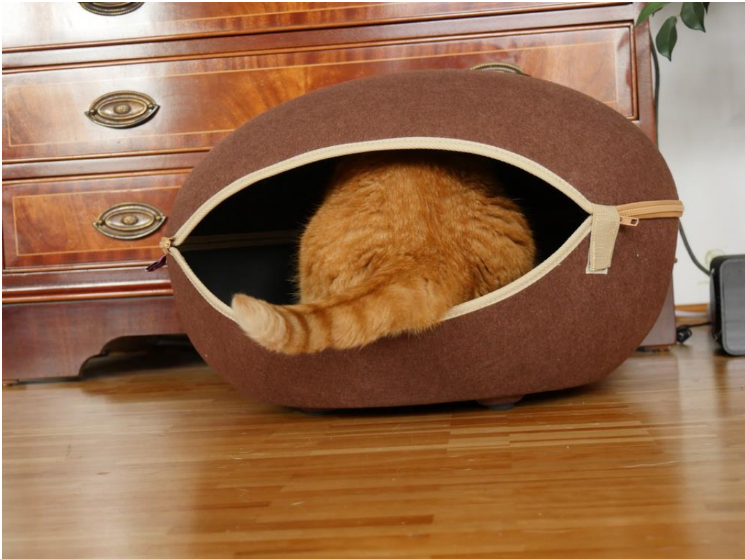
Hier riecht es ....